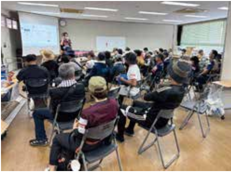
▲ボランティアへのオリエンテーションのようす

一般ボランティアに加え、重機をご提供のうえ活動いただいた技術系ボランティアの皆様、センターの運営を側面から支えてくださった県・市議会議員や各団体の皆様、そして応援にかけつけてくださった県内外の社会福祉協議会の皆様からのお力添えに心から感謝申し上げます。