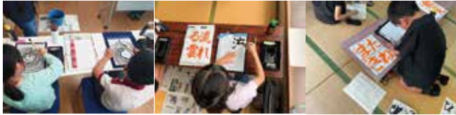
習字教室(始良・加治木・蒲生)

子どもたちの学習の機会や居場所づくりを目的に、子どもの学習支援・生活支援マナビバを始良・加治木・蒲生の3か所で行っています。ボランティアさんやお友達と一緒に勉強や遊び・おしゃべりなど楽しく過ごせる、子どもたちの居場所づくりを目指しています。