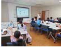
きれいを学ぼう！ (紫外線について)