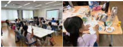
お金教室(始良・加治木)