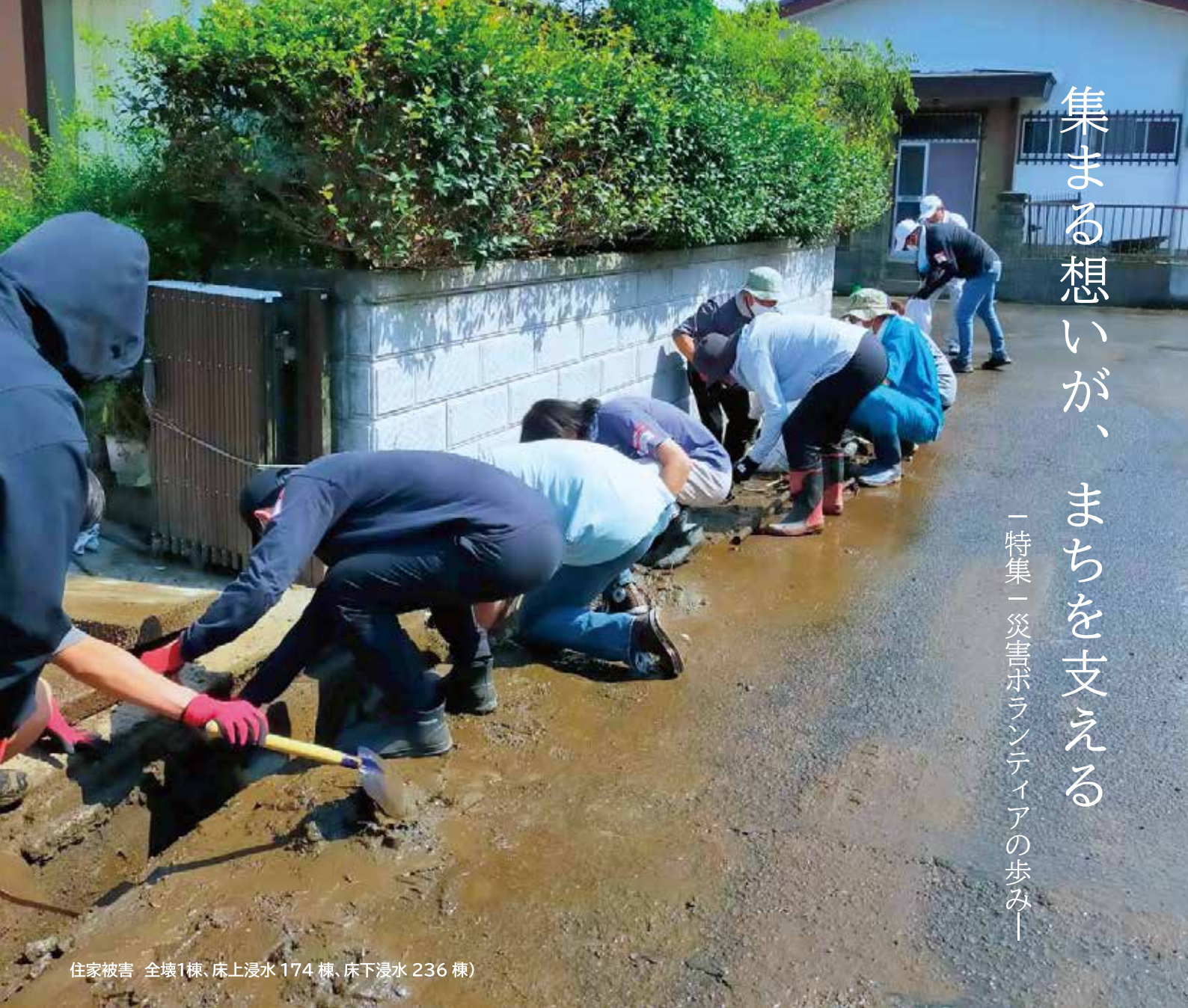
住家被害 全壊1棟、床上浸水 174 棟、床下浸水 236 棟)