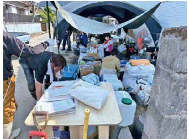
▲重富サテライトでは現地マッチングでニーズとつなぐ