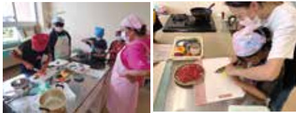
料理教室(始良・加治木)